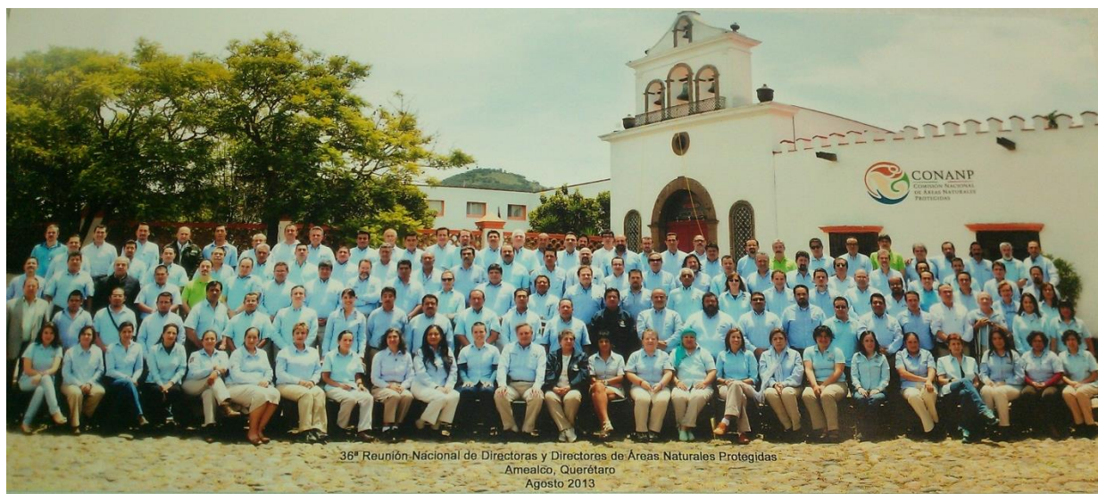
Figura 3. 36 Reunión Nacional de Directoras y Directores de Áreas Naturales Protegidas donde se validaron los ejes de la E2040.

Mayor información: estrategia2040@conanp.gob.mx