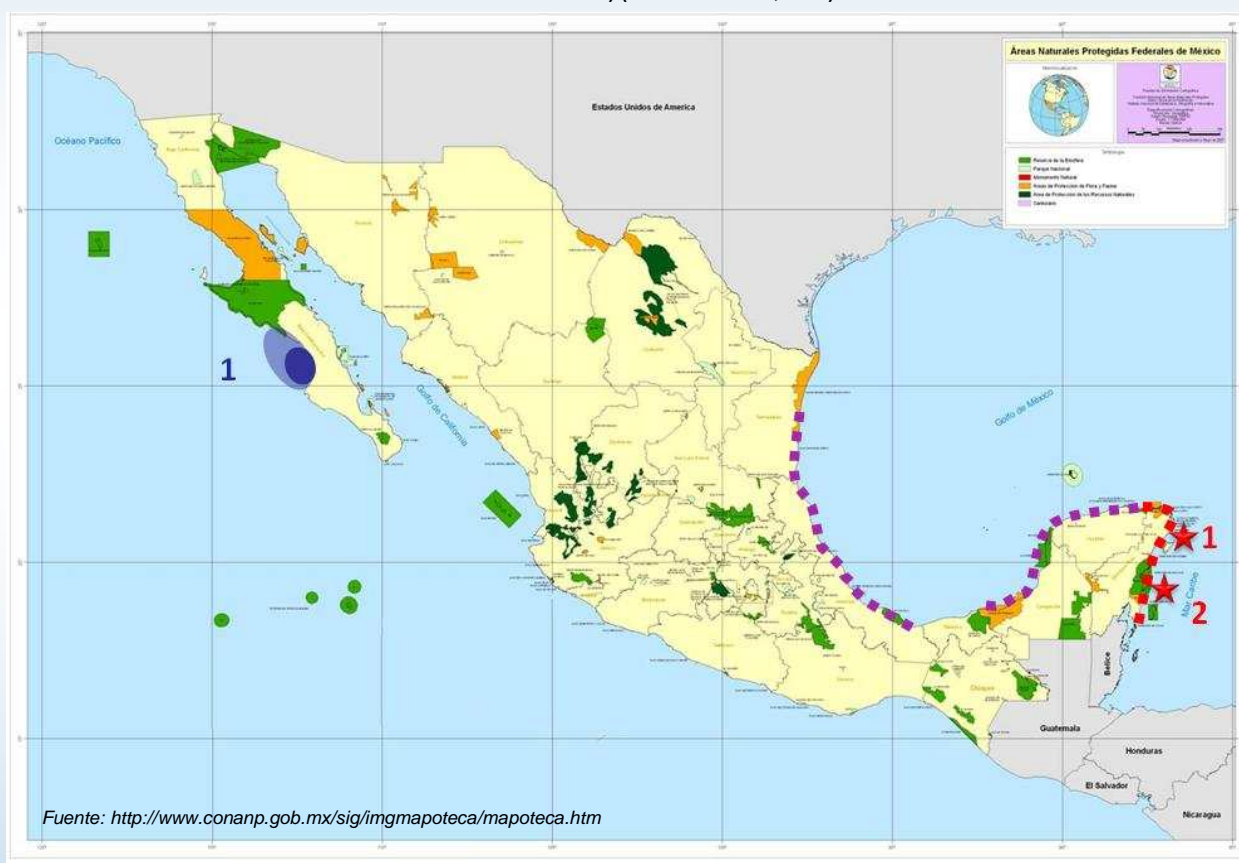
Mapa 1. Distribución de la de tortuga caguama en México (Distribución tanto en Áreas Naturales Protegidas, como fuera de ellas)