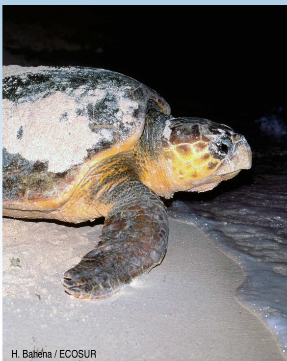
H. Bahena / ECOSUR