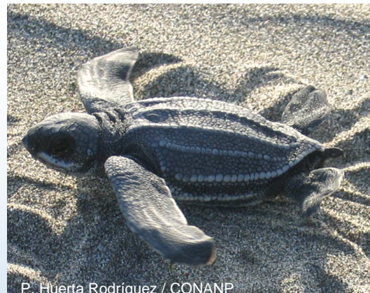
P. Huerta Rodríguez / CONANP

En las crías se reconoce un periodo de intensa actividad llamado “frenesí infantil” o “frenesí natatorio”, mecanismo que les permite moverse del nido hacia el mar en el menor tiempo posible, reduciendo la posibilidad de ser depredadas (Lohman et al. , 1997). La hiperactividad comienza cuando las crías ascienden del interior del nido hacia la superficie y continúa al menos un día. Los organismos en frenesí natatorio pueden llegar a nadar a una velocidad de hasta 1.57 km/hr.