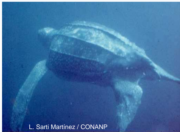
L. Sarti Martínez / CONANP

Al igual que otras tortugas marinas, esta especie contribuye a mantener el equilibrio en la red trófica de la que forma parte. Tortugas laúd han sido observadas consumiendo grandes cantidades de medusas (más de 200 kg/d; Durón-Dufrenne, 1987, en Houghton et al. , 1997); en una teoría aún no comprobada se expone que en aguas abiertas, al disminuir la población de laúd que funciona como depredador de las medusas, puede llegar a incrementarse la población de estos cnidarios que se alimenta de larvas de peces y crustáceos, afectando entonces el reclutamiento de éstos últimos (Gulko y Eckert, 2004).